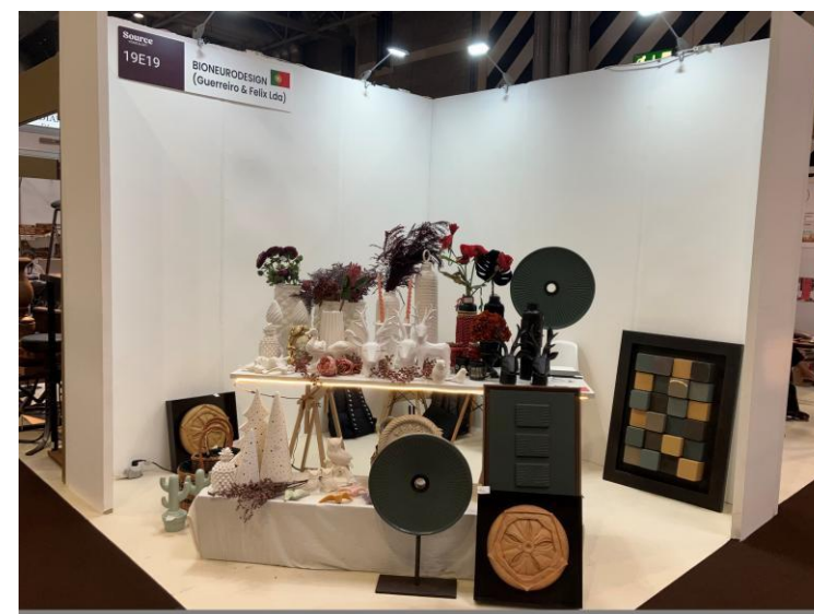
優選展位搭建效果