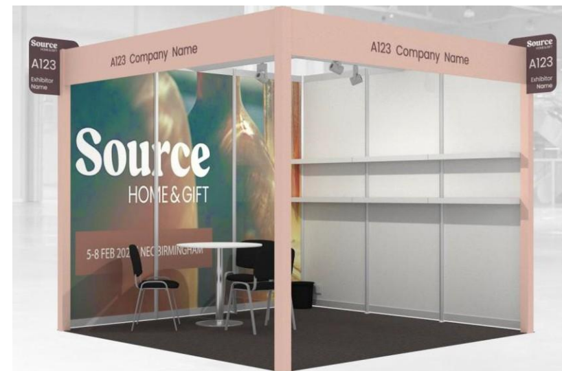
標準展位搭建效果