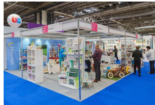
2.5米高展位搭建效果