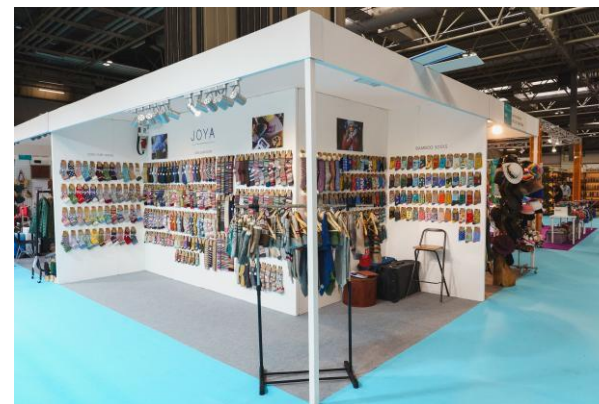
2.7米高展位搭建效果