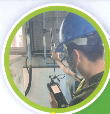
設備機房溫度檢測