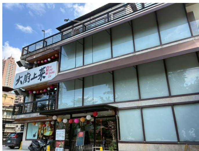
大廚上菜(新北市新店區環河路 29 巷 23 號)

順著此條路一直往前走 看到建築物旁的小 路(環河路 29 巷)繼續走約 3 分鐘即抵達餐廳